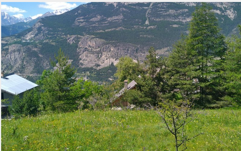
Le clot de Rama (M. Buffet)