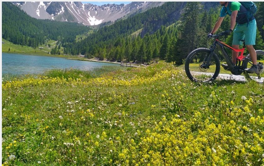
le lac de l'Orceyrette (M. Buffet)