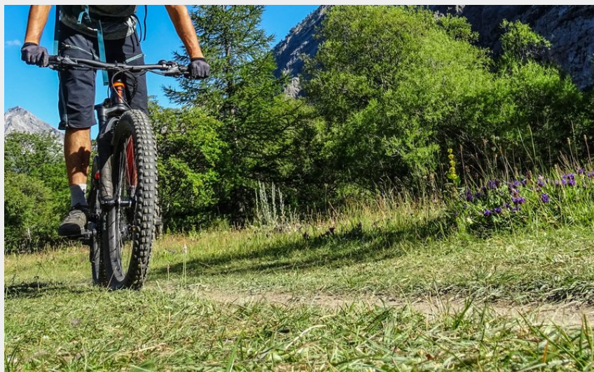
Vététiste dans la Vallée Etroite (M. Buffet)