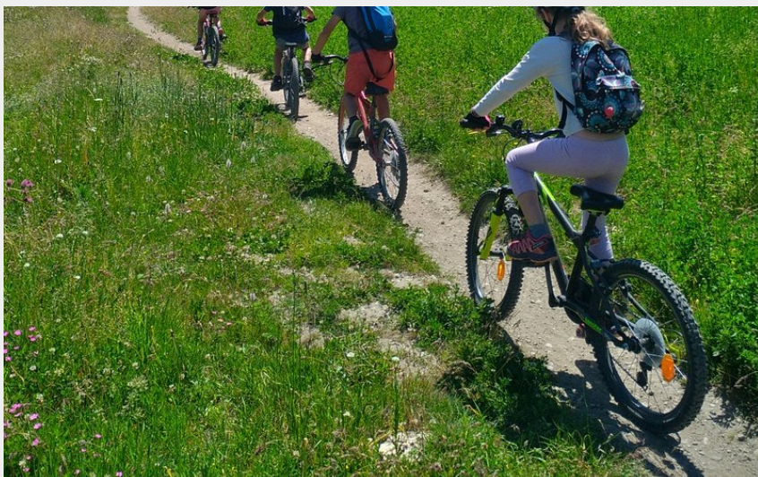
Balade familiale entre les prés (M. Buffet)