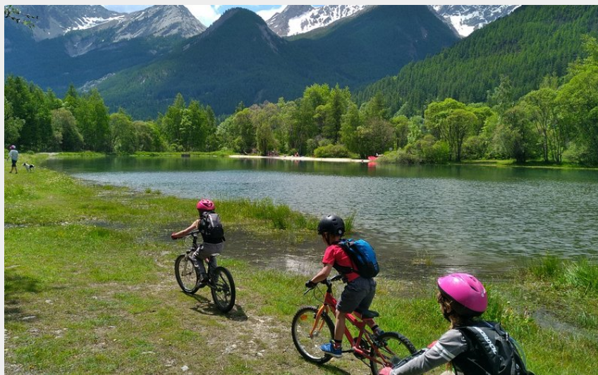
Le plan d'eau du Casset avec l'Yret au dernier plan (M. Buffet)