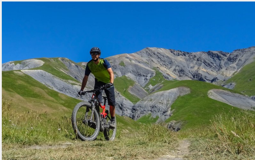
Descente dans le vallon de la Buffe (M. Buffet)